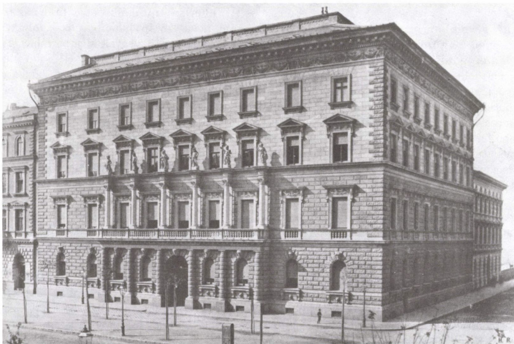
A konzuli palota