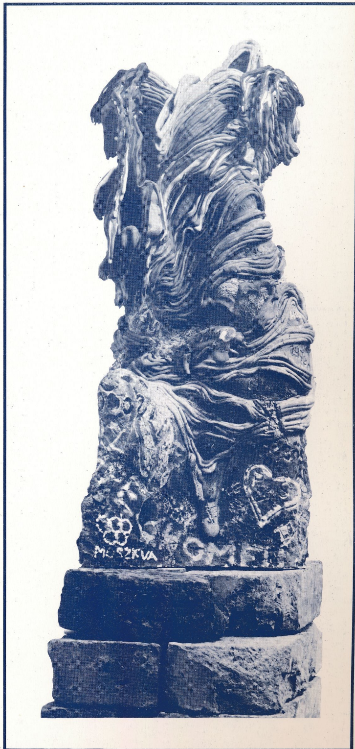
„Portré: Október” 1982 porcelán, 1360 °C 19x11x5 cm