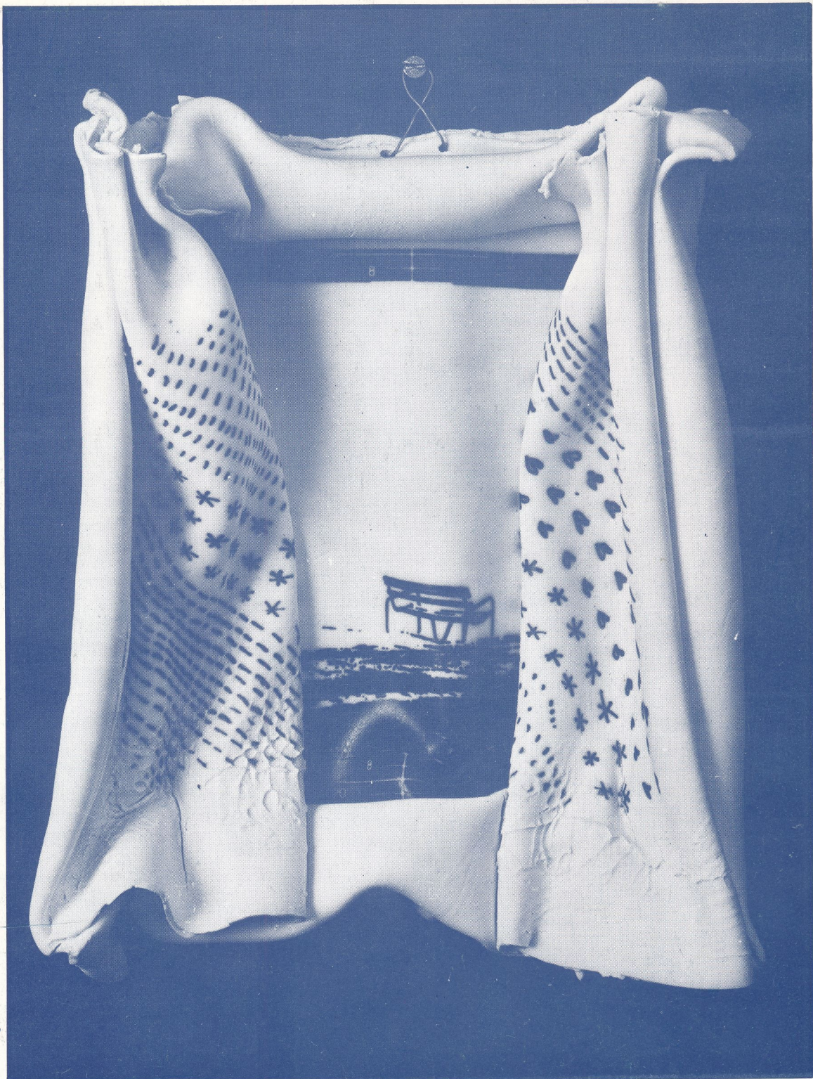
„Magányos pad” 1982 porcelán, 1360 °C 31x29 cm