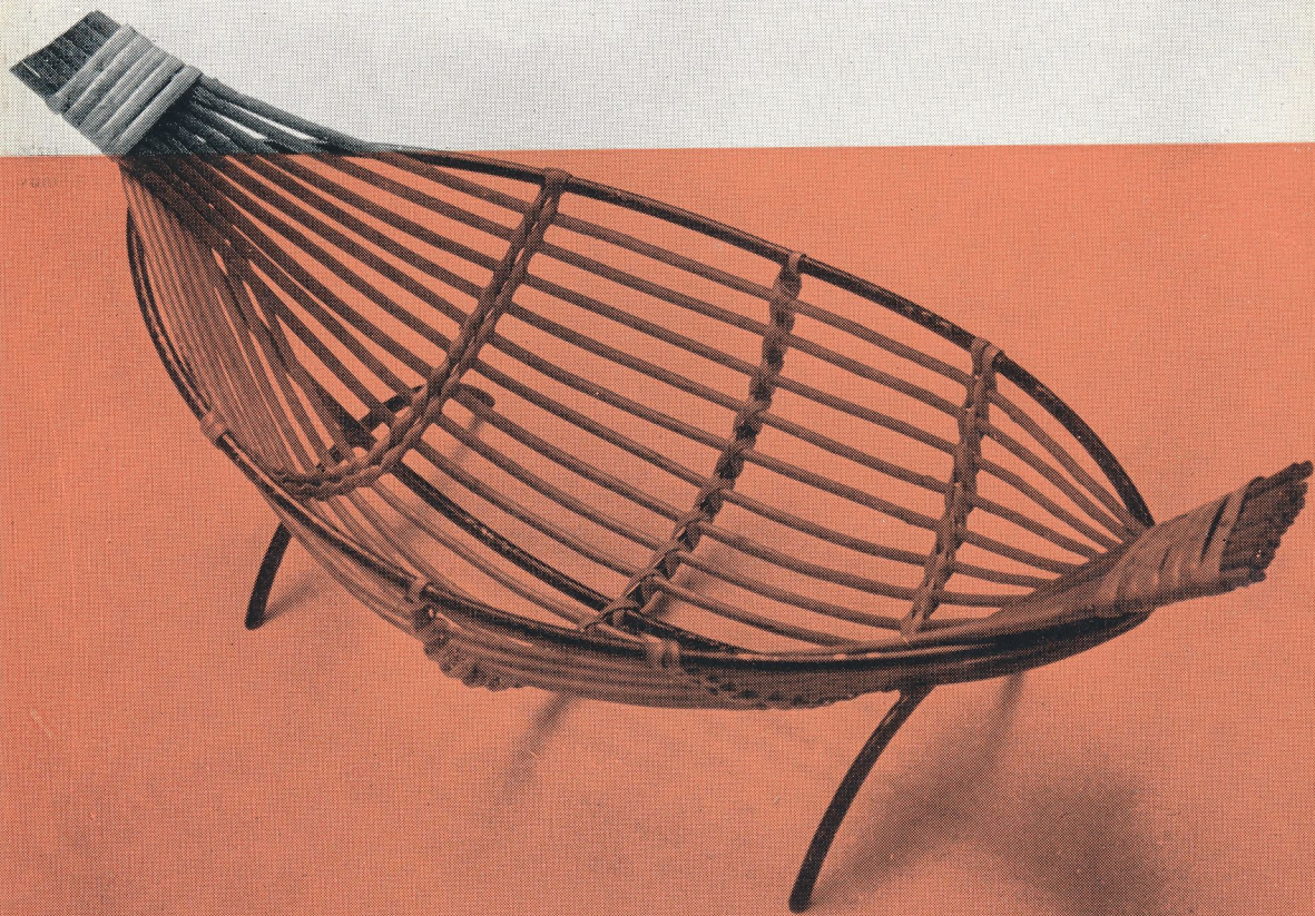
Kocsis Béla Gyümölcskosár