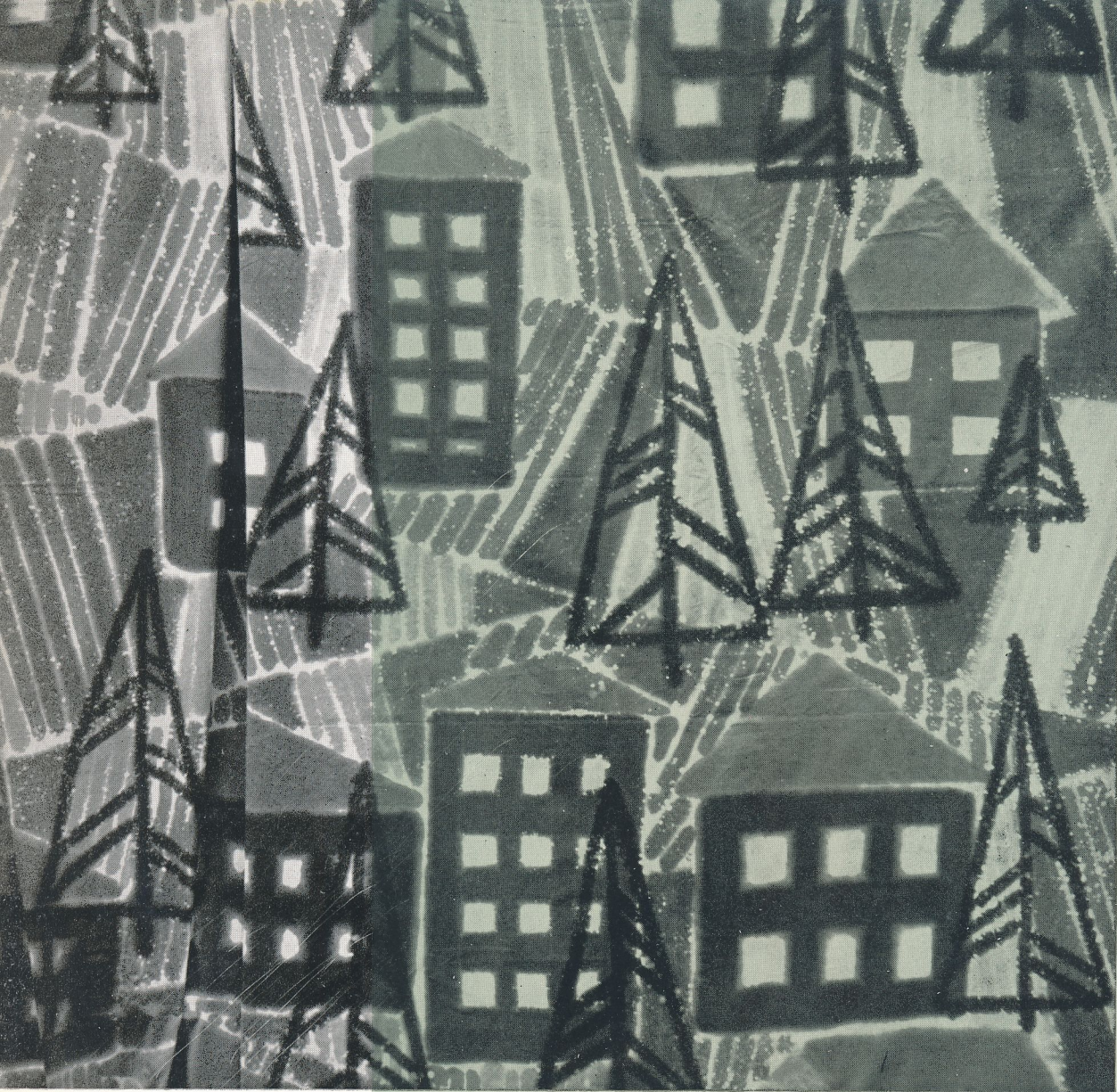
4. SZUPPÁN IRÉN: FÜGGÖNY (RÉSZLET)