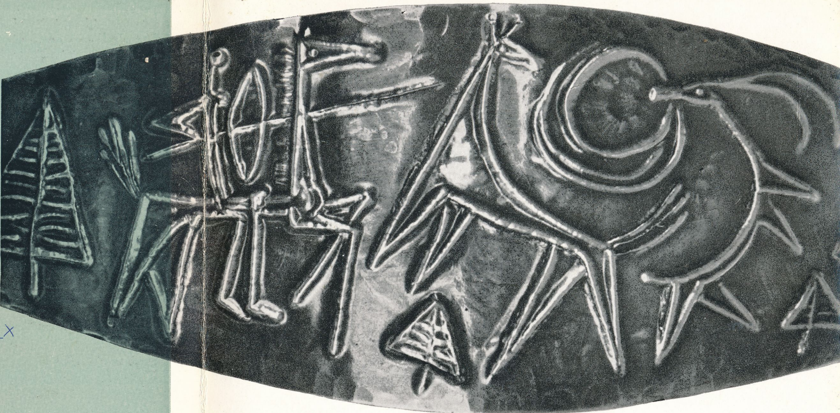
3. ENGELSZ JÓZSEF: KARPEREC (RÉSZLET)

a kar, kéz, mely a kiterített a meg Engelsz merészségét: ak realiztikusan, dombormű ett azonos, — vagy nagyon az ezüstözött réz patinázottan magában felhasználva, a dáma ve a kártyadoboz gondolatát. zetését megértve, tud modern toknál. A lakás oly hétköznapi