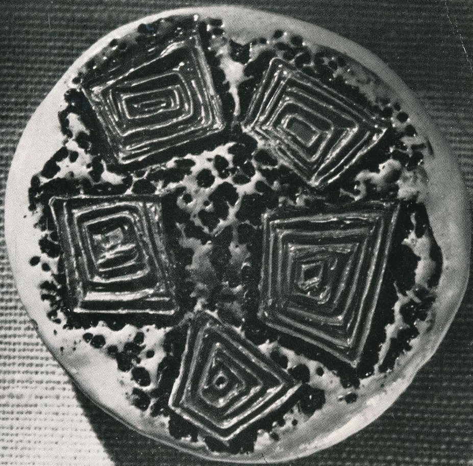
BARTA ÉVA: KERÁMIA RUHADÍSZ (NAGYÍTÁS)