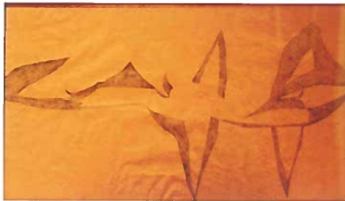
Zenei ütemek 1938 szén, papír 50,5x87,5 cm