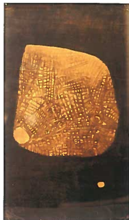
Wulcs maszk szén, papír 61.5x36 cm