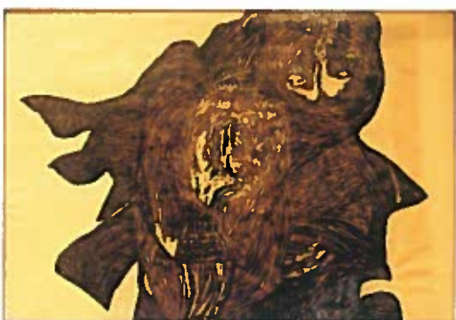
Bagoly fészekkel 1940 szén, papír 61x87 cm