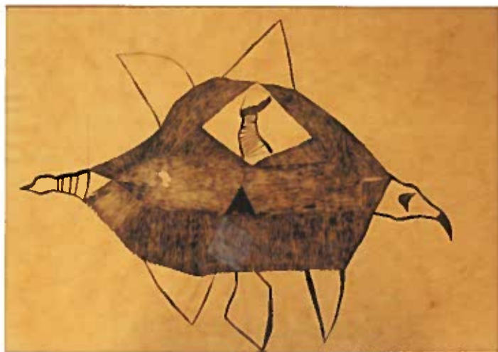
Sün ezüst négyszögek 1938 szén, papír 60,5x87 cm