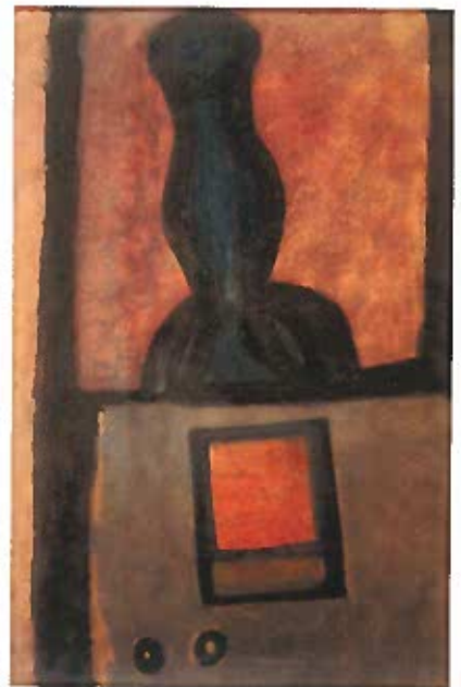
Csendélet könyvvel 1935 körül olaj, papír 45x29 cm