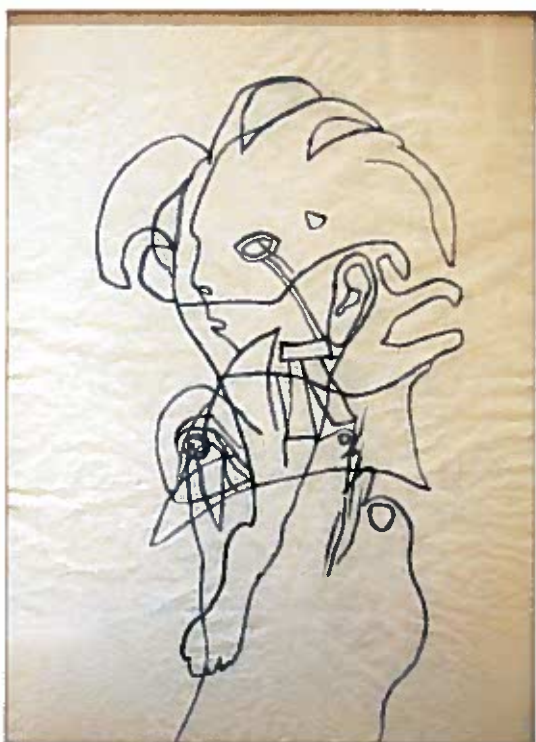
Fej és végtagok 1938 szén, papír 61x45 cm