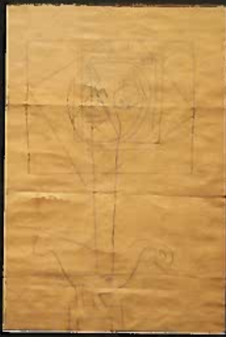
Csendélet madárral 1930 ceruza, papír 47x31,5 cm