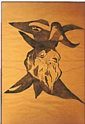
Áttetszó testű madár 1939 szén, papír 87x60,5 cm