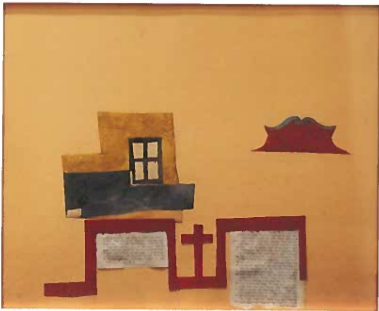
Szentendrei motívumok kereszttel, héber szöveggel 1937 körül kollázs 37,5x46,5 cm