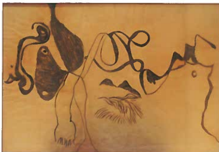
Lepkeszárnyak, szalagmotívumok 1938 szén, papír 63x94 cm