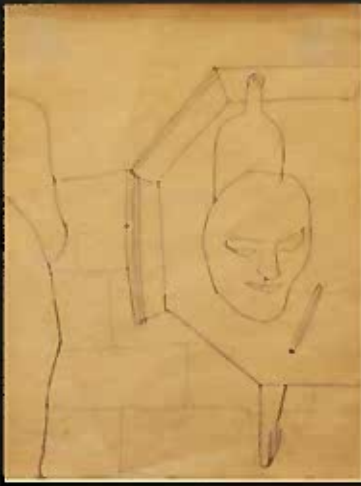
Asztali csendélet palackokkal és maszkkal ceruza, papír 20x15 cm