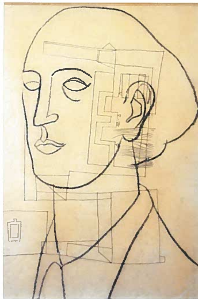
Önarckép architektúrával 1938 ceruza, papír 44x29 cm