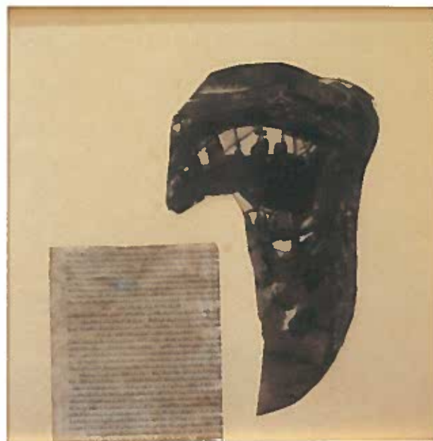
Maszk héber szöveggel 1937 körül kollázs 40x40 cm