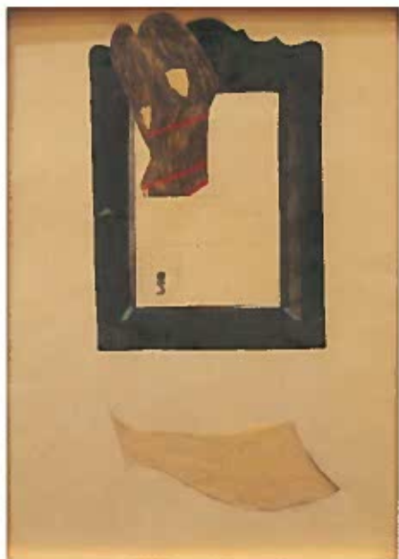
Ablakok zárral 1937 körül kollázs 34x25 cm