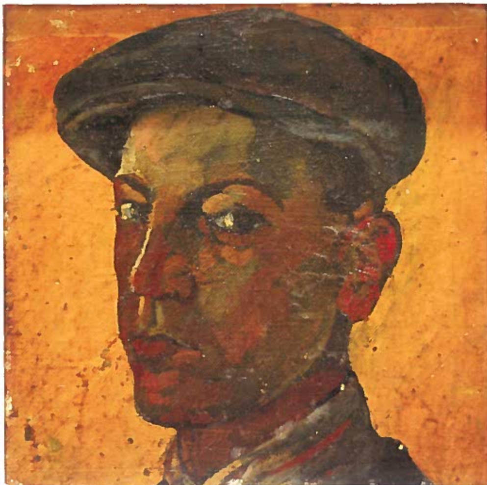
Sapkás önarckép 1925 olaj, karton 37x36cm